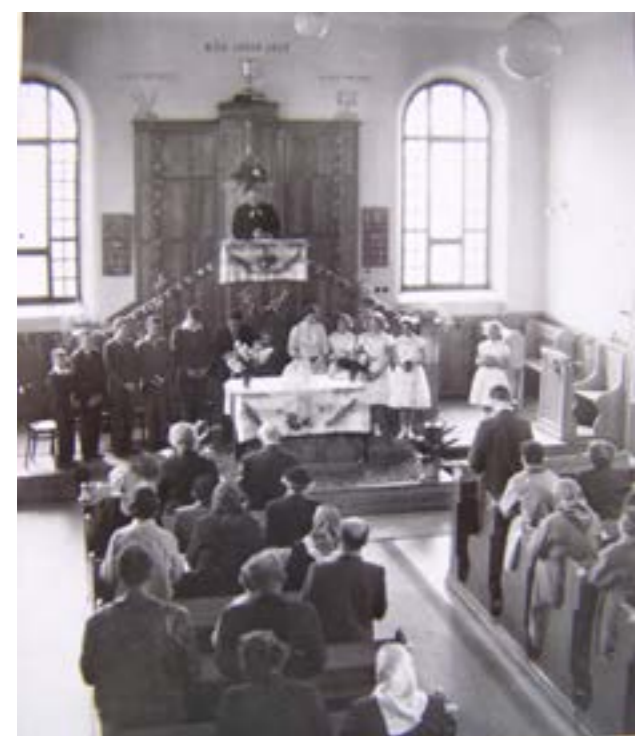
Shromáždění při confirmaci.

Obě budovy byly v rekordním čase (půl roku) adaptovány na evangelický kostel a sborový dům . Adaptace synagogy byla velmi citlivá , takže nepřekryla svébytný ráz budovy. Koupě budov v ceně 300 000,- Kč a jejich adaptace v hodnotě 200 000,- Kč byla umožněna jen díky velké obětavosti členů sboru i celé církve, protože sbor tak velkou částku nevlastnil. Na nutných úpravách se účastnili především členové sboru, kteří pracovali dobrovolně a s velkým nadšením.