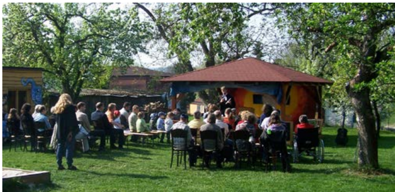
Na větší shromáždění naše prostory už prostě nestačí...