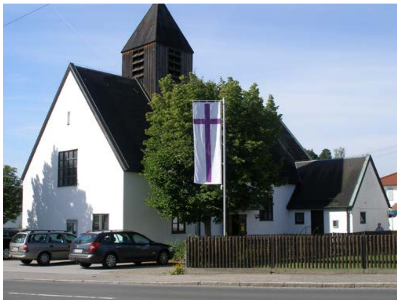
Nittenau 2006 – společně se starosty měst (Přeštice, Nittenau) a představiteli evangelické církve.

Křesťané nežijí jen na našem evropském kontinentě. Již podvkrát zavítali do našeho sboru křesťané z Jižní Koreje, ze sboru Dongan Church v Soulu. V Jižní Koreji je křesťanství na vzestupu , křesťanů zde stále přibývá a tvoří významnou část obyvatelstva. Veřejnost se mohla s našimi hosty rovněž seznámit při besedách , které sbor při této příležitosti uspořádal.