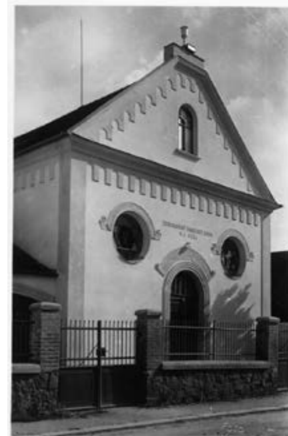
Chrám Mistra Jana Husa.

A tu docházelo i k tříbení a snad i zklamání některých. Mnozí se stali členy sboru na základě tzv. přestupového hnutí , kdy byli motivováni spíše svým vlastenectvím, nežli opravdovou touhou po obrodě srdce. Mnozí nadšeně souhlasili s myšlenkami české reformace, ale již je nechtěli přijmout za své. Ale našlo se mnoho těch, kteří své rozhodnutí stát se evangelíky mysleli upřímně a ti se