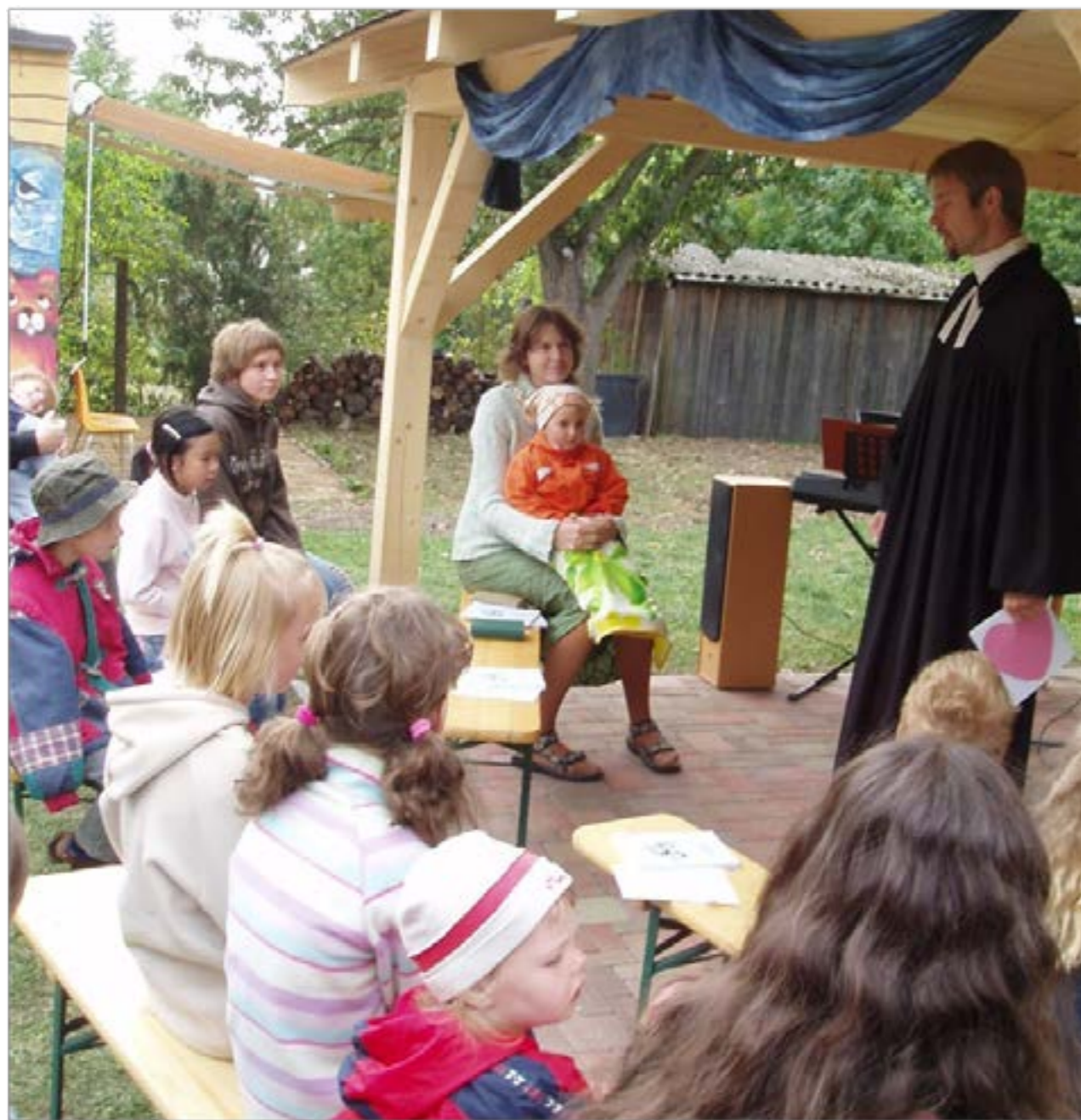
Děti v centru dění – dětské bohoslužby (v prostoru zahrady).

Děti patří do našeho společenství stejně jako kdokoliv jiný a je třeba, aby to věděly a prožívaly. Proto jsou tu bohoslužby pro děti, které jednoduchým způsobem předávají základní věci víry a důležité hodnoty. Děti se účastní těchto bohoslužeb spolu s dospělými a tak mohou všichni zažívat hezké společenství – patříme dohromady a jdeme stejnou cestou. Bohoslužby pro děti běží pravidelně od roku 2006.