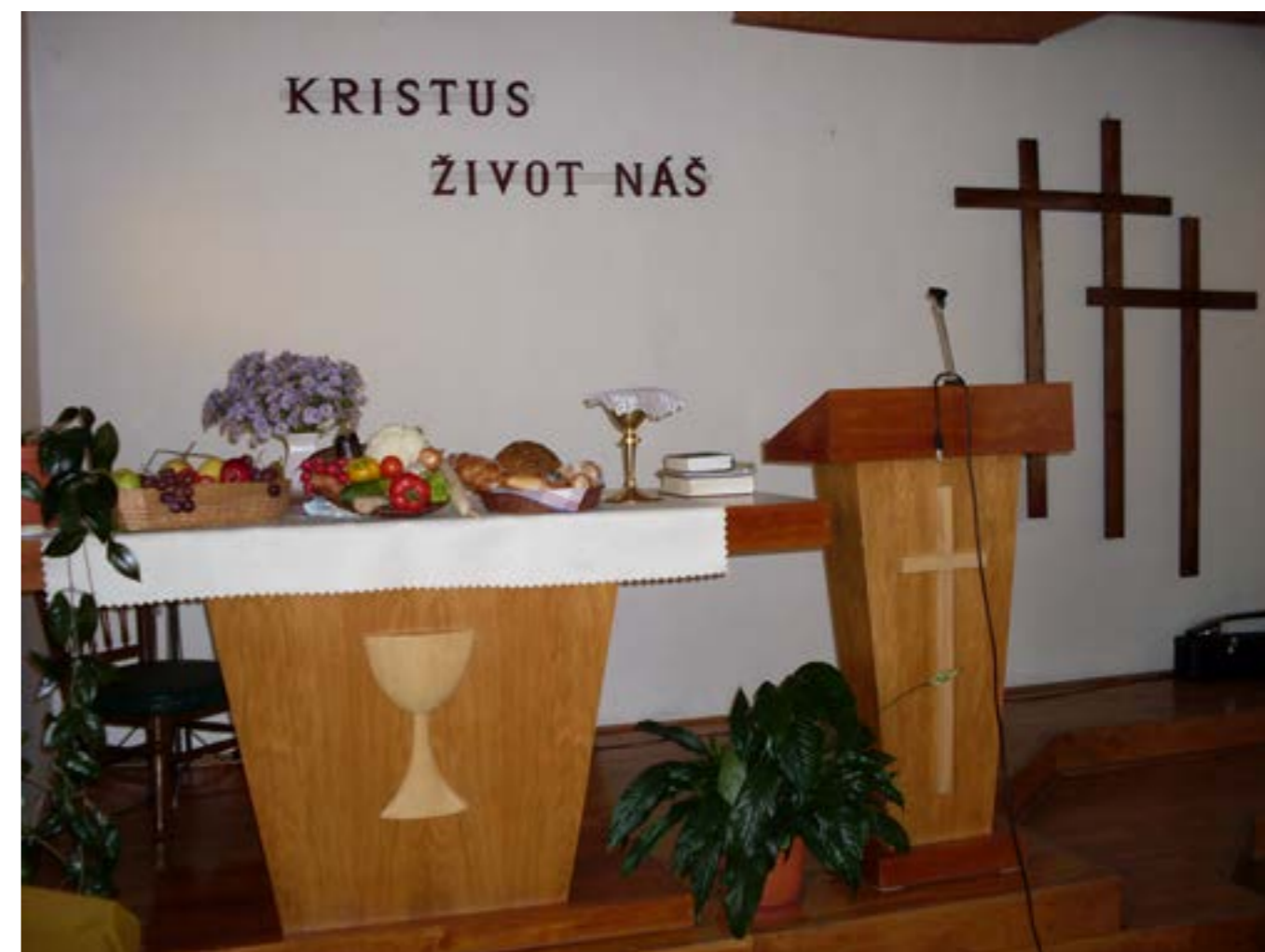
Modlitebna Církve bratrské v Klatovech – díkyvdání za úrodu.

Označení kazatelská stanice znamená, že v místě nebydlí farář a sbor není samostatný – nemá svou správní radu (staršovstvo) a je spravován ze sídla sboru – v případě Klatov z Přeštic.