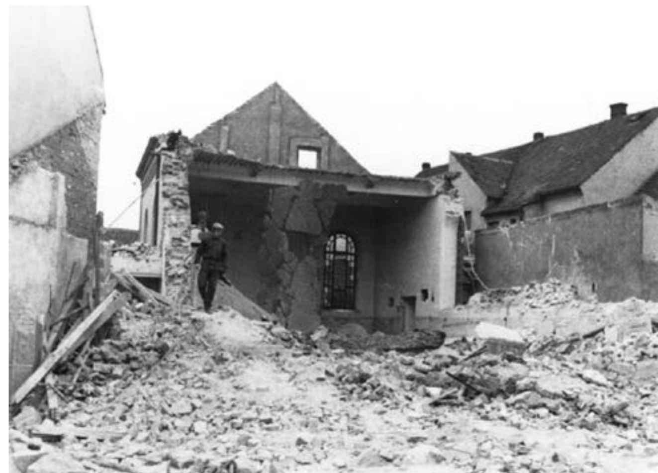
Zboření evangelického kostela.