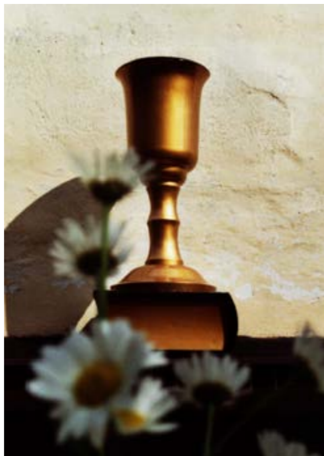
Bible a kalich – znak českých evangelíků.

Jsme křesťané. Lidé, kteří následují Ježíše Krista. Věříme, že náš život má smysl – protože nás stvořil Bůh a má nás rád. Věříme, že smysl života není v tom, mít hodně majetku, slávy nebo být zdravý – ale v lásce k Bohu, k lidem a sobě samému. Věříme, že konec všech věcí má v ruce Bůh, který je dobrý a zároveň spravedlivý. Věříme, že my lidé dobří