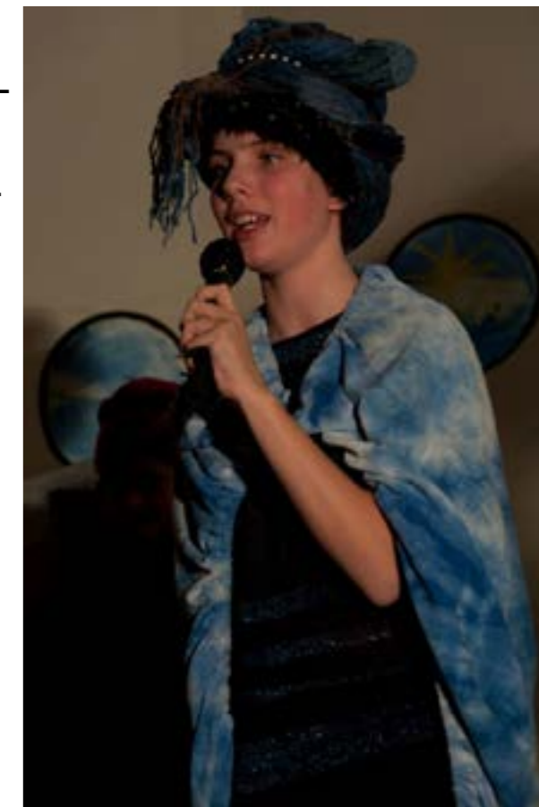
Z vánoční hry...

Vše, co se ve sboru děje, tak není záležitostí jen faráře, ale celého sboru. Proto se sborové aktivity mohou rozebíhat do široka. Každý z členů sboru zde může najít své uplatnění a rozvíjet své obdarování.