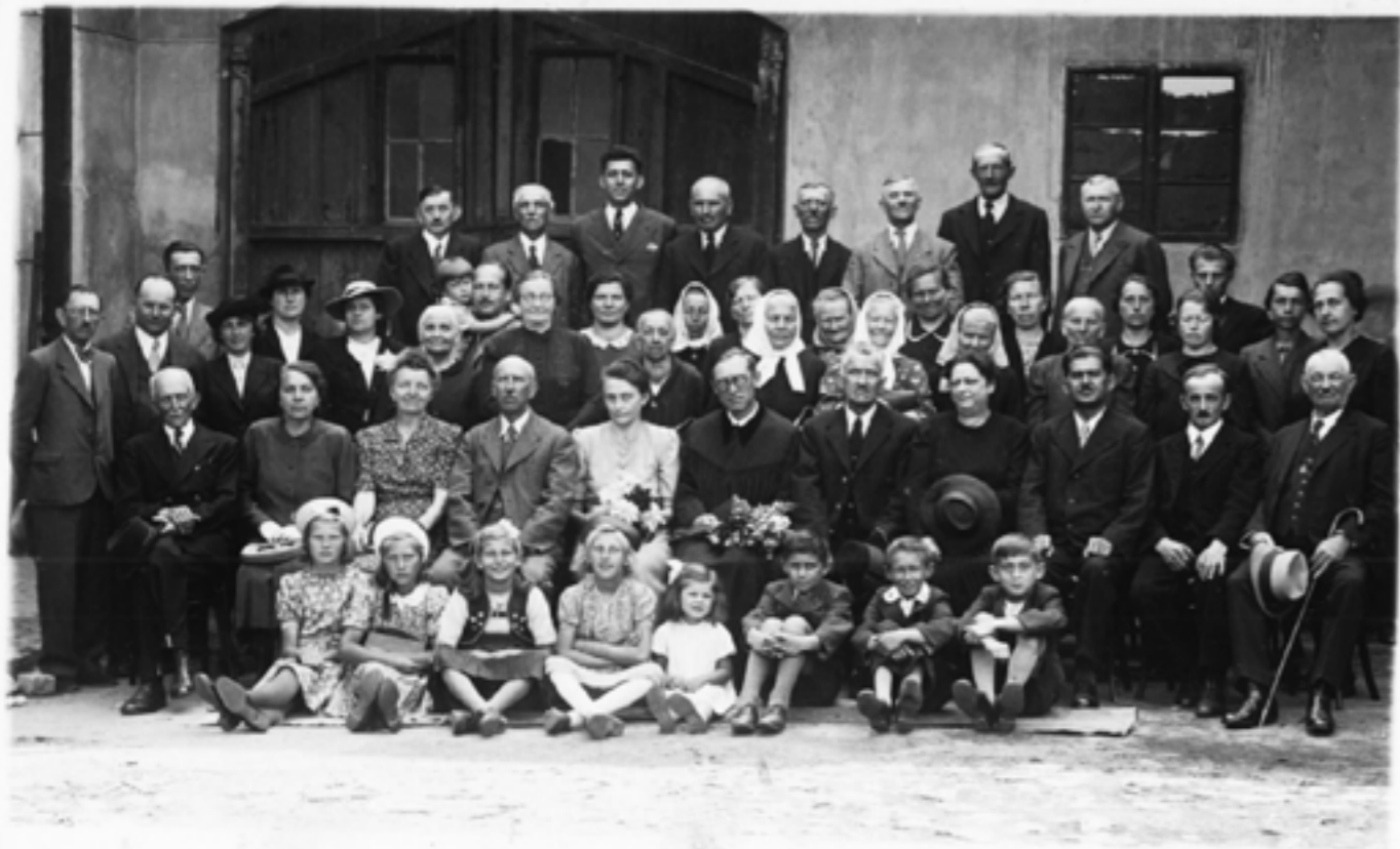
Před radnicí, kde se sbor po dlouhá léta scházel k bohoslužbám.

evangelictví, tedy o Janu Husovi, o hnutí, které vyvolala jeho násilná smrt (jež nazýváme husitské) a které mělo provést nápravu církve, tedy reformaci . Snaha o návrat církve k původní podobě, jak ji známe z Bible, však nebyla přijata, evangelické křesťanství bylo odsouzeno k ilegality. Těmito a dalšími slovy přibližoval E. Otter posluchačům dějiny a myšlenky české reformace a evangelictví – nikoliv evropského, kterému bylo dáno kráčet jinou, úspěšnější cestou.