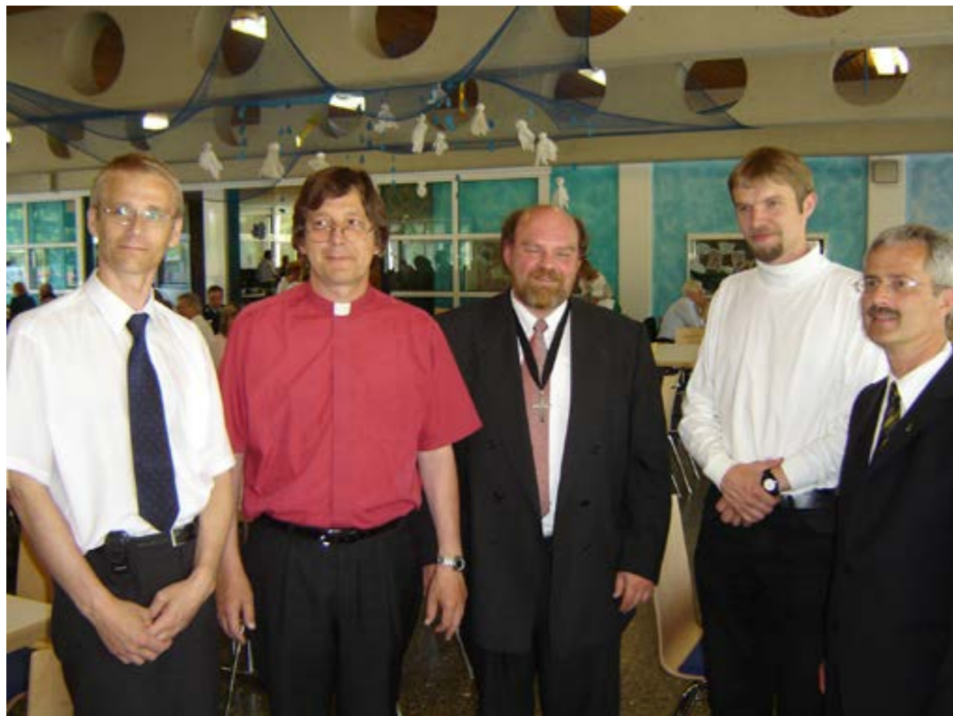
Nittenau 2006 – společně se starosty měst (Přeštice, Nittenau) a představiteli evangelické církve.

To nás povzbuzuje ve víře v Boha – který nás smířil se sebou a vede nás i ke smíření mezi sebou navzájem. Manifestem tohoto smíření jsou i dobré vztahy mezi našimi evangelickými sbory. Jsme za ně velmi vděční.