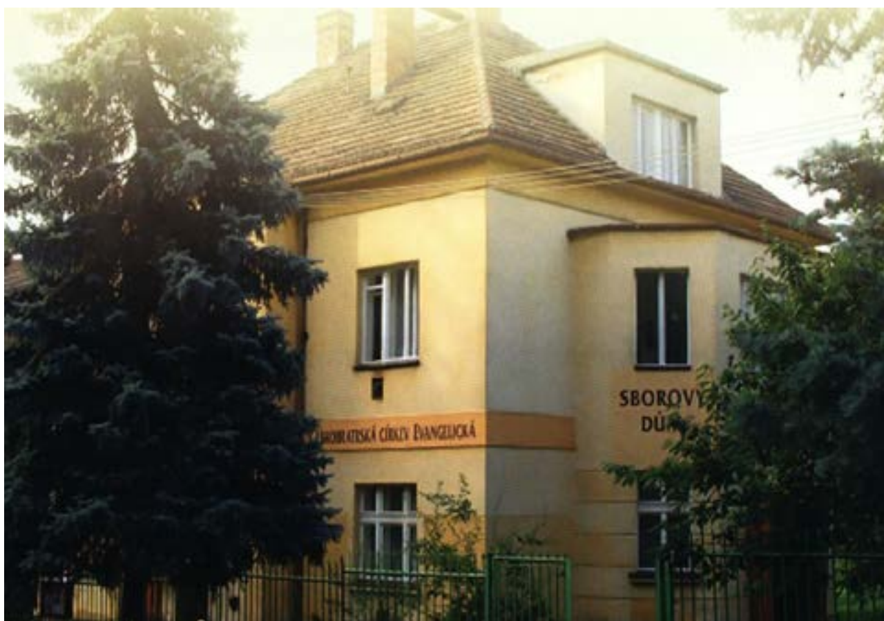
Evangelická fara / sborový dům. Kostel a fara v jednom.

Nebo také - po které jej někdo vede. Věříme, že naše životy nejdou bezcílně. Že nás vede někdo, kdo se nazývá dobrým Pastýřem, který vede své stádečko. Že nás provází Bůh ve své lásce a milosti, kterou nám dává poznávat na Ježíši, svém Synu. „Mou cestu v rukou máš, jdu s důvěrou“ je název jedné písně, kterou rádi zpíváme.